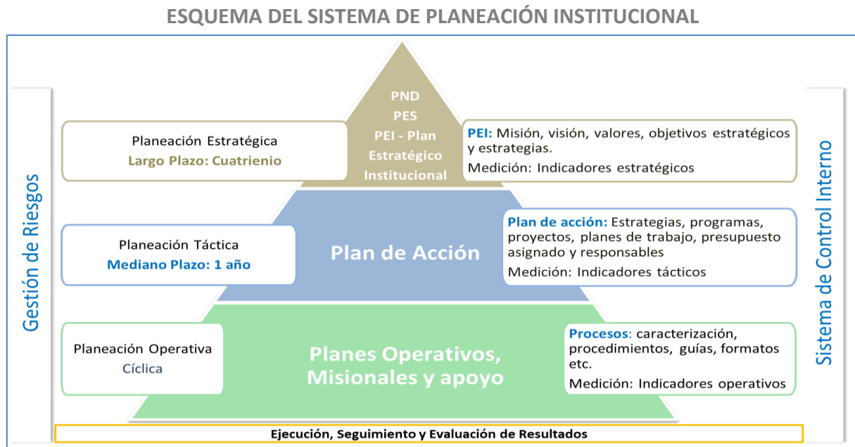
Ilustración 3: Esquema del Sistema de Planeación Institucional.

La política de planeación institucional descrita a continuación, cuenta con la definición del marco estratégico, objetivos, estrategias y a su vez, metas e indicadores planteados para la gestión y desempeño institucional en los frentes misionales de RPM, BEPS, Canales de Atención, y en todas las áreas de soporte y apoyo.